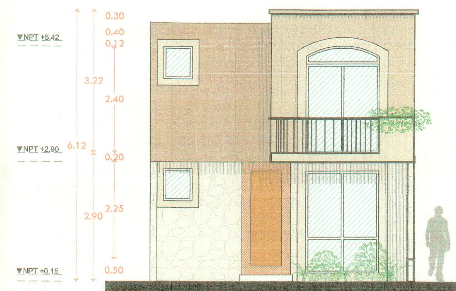
Fachada principal arquitectónico